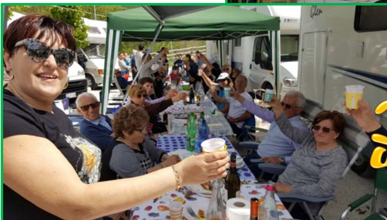
La tavolata del 1° maggio